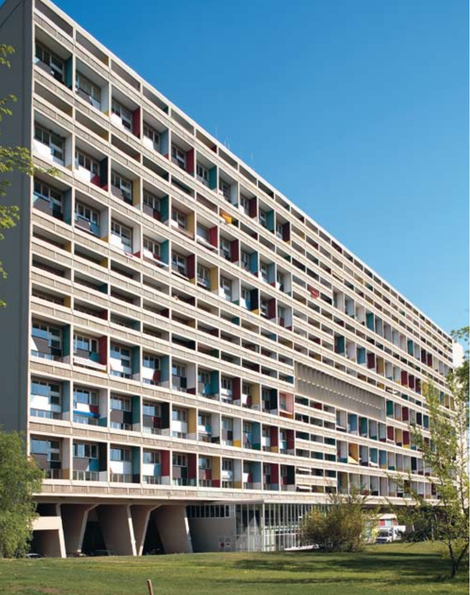
Unité d'Habitation „Typ Berlin“, 1956–58, Le Corbusier